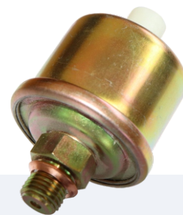
■ Датчик давления DDM.016