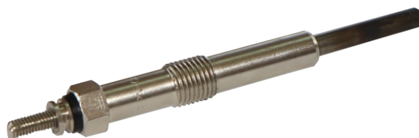
■ Свеча накаливания TPA-C11